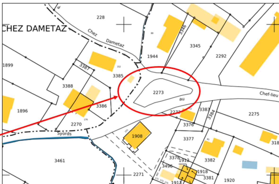
Plan du cadastre existant