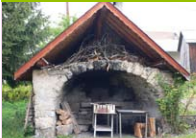
Four à pain, Bovère.

A la campagne, on cuisait généralement encore à domicile aux alentours de 1900, dans des fours pouvant contenir 15-25 pains et qui étaient chauffés au bois. La cuisinière à gaz ou la cuisinière électrique n'existait pas encore à cette époque. Tout le monde ne disposait toutefois pas d'un four à pain. Ils étaient généralement réservés aux grandes fermes. La cuisson avait lieu une fois par semaine. Lorsqu'ils ne possédaient pas de four à pain, les gens pouvaient faire cuire leur pain chez un voisin ou dans un four communautaire. Un tel four existait souvent dans les villages, généralement sur la place. Quatre d'entre eux subsistent encore dans la commune, et sur les deux se situant à Bovère, un est toujours utilisé de façon ponctuelle.