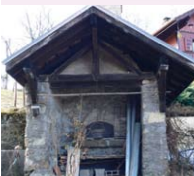
Four à pain, Romblaz d'en Bas.

A la campagne, on cuisait généralement encore à domicile aux alentours de 1900, dans des fours pouvant contenir 15-25 pains et qui étaient chauffés au bois. La cuisinière à gaz ou la cuisinière électrique n'existait pas encore à cette époque. Tout le monde ne disposait toutefois pas d'un four à pain. Ils étaient généralement réservés aux grandes fermes. La cuisson avait lieu une fois par semaine. Lorsqu'ils ne possédaient pas de four à pain, les gens pouvaient faire cuire leur pain chez un voisin ou dans un four communautaire. Un tel four existait souvent dans les villages, généralement sur la place. Quatre d'entre eux subsistent encore dans la commune, et sur les deux se situant à Bovère, un est toujours utilisé de façon ponctuelle.