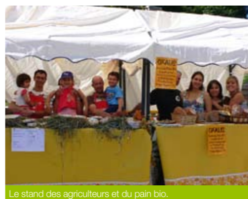
Le stand des agriculteurs et du pain bio.