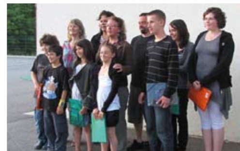
Le conseil municipal des jeunes avec Madame le Maire et la commission enfance et jeunesse.

Les membres du CMJ ont déjà eu l'occasion de participer à la cérémonie du 8 Mai avec le Conseil Municipal, et de venir à la rencontre des Anciens du village au cours de l'apéritif précédent leur repas. Ils ont aussi participé à la mise en place, avec le SIVOM de Cluses, du projet de composteur pour le restaurant scolaire.