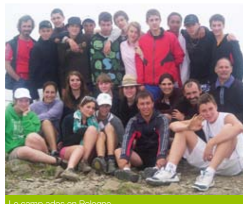
Le camp ados en Pologne.

Ce projet me tient à cœur et je l'ai suivi de très près.