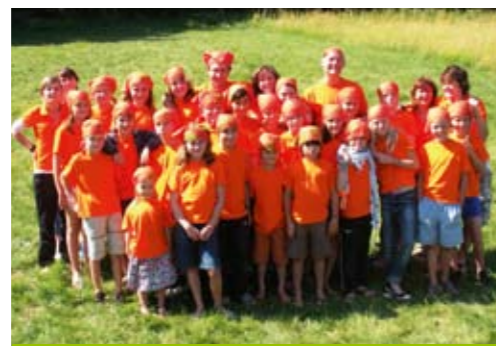
Le camp des Petits Indiens en Haute-Loire.

Nous en profitons pour remercier tous ceux qui nous soutiennent pour l'organisation de ces activités et ces manifestations qui nous permettent de poursuivre nos projets d'aide humanitaire en Afrique.