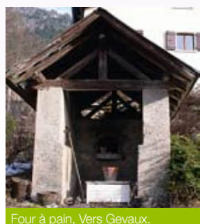
Four à pain, Vers Gevaux.